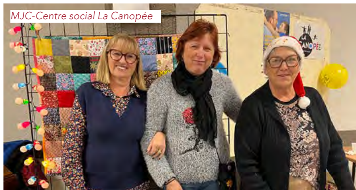
MJC-Centre social La Canopée