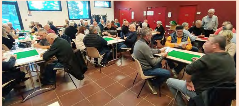
L'Entame portoise organisait les 12 et 13 novembre à la salle Fernand Léger, un tournoi de tarot en donne libre. Venus de la Drôme, de l'Ardèche, du Vaucluse et du Rhône, plus de 200 joueurs se sont affrontés dans la bonne humeur.