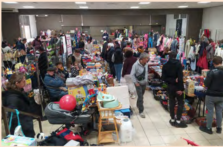
Une nouvelle fois, le succès était au rendez-vous de la bourse aux jouets organisée par le Twirling Club Portes-lès-Valence. Le 27 novembre, la salle Georges Brassens a fait le plein d'exposants et de visiteurs, pour le plus grand plaisir des bénévoles.