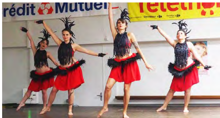
École de danse La Mouette