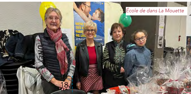
École de dans La Mouette