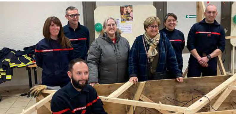
L'Amicale des sapeurs-pompiers