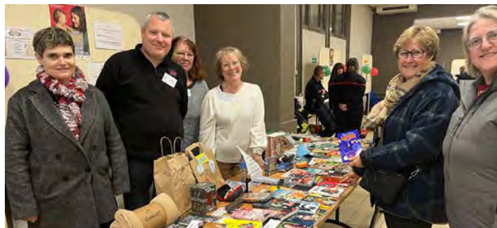
Les Portes de l'emploi