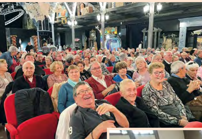
Les activités ne manquent pas au Club Ambroise Croizat : un spectacle de Dani Lary aux Ateliers Magiques de Barbières le 8 novembre, ainsi que des festivités à l'occasion des anniversaires du second semestre le 17 novembre, salle Georges Brassens.