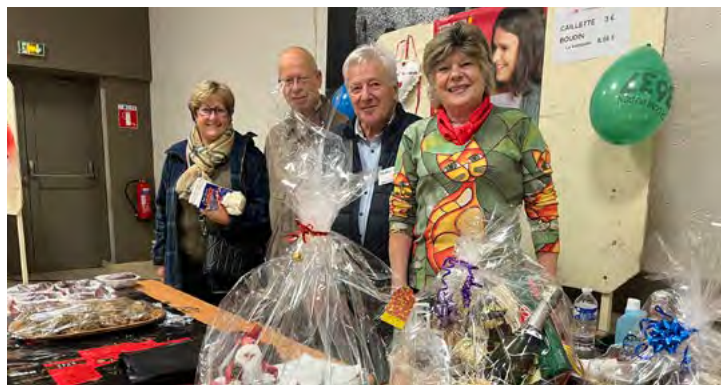
Conseil de quartier Ouest